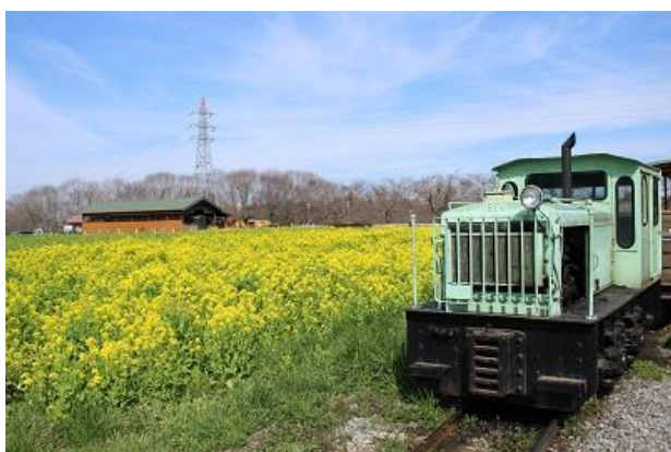
↑うさぎ乗務員が同乗するトロッコ列車。時期が合えば菜の花も楽しめる

「うさケツ展」は、 スタッフ1人につき、100枚のお尻写真を撮るというノルマ を設け、写真を見るだけで癒される空間作りをすべく、日々撮影に尽力しております。様々な施設でイースターイベントは実施されておりますが、生のうさぎと一緒に楽しむイースターは格別です。