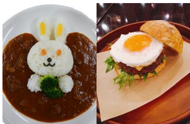
↑左: ガラスハウス「うさちゃんハヤシ」 右: ファームカフェ「自然いっぱいライ麦パンの牧場エッグバーガー」