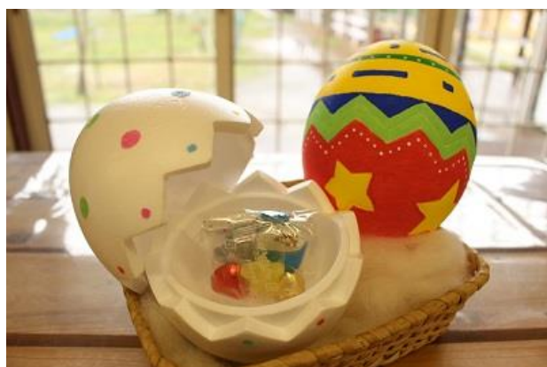
↑世界に一つだけのオリジナルイースターエッグ。 中にお菓子を入れてプレゼント