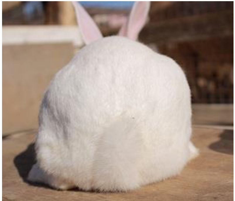
うさぎのお尻写真を展示する「うさケツ展」↑

今年は4月7日(土)・8日(日)を「うさぎデー」とし、加えて3月24日(土)～4月22日(日)の「スプリングフェア」にて、イースター関連イベントを複数実施いたします。